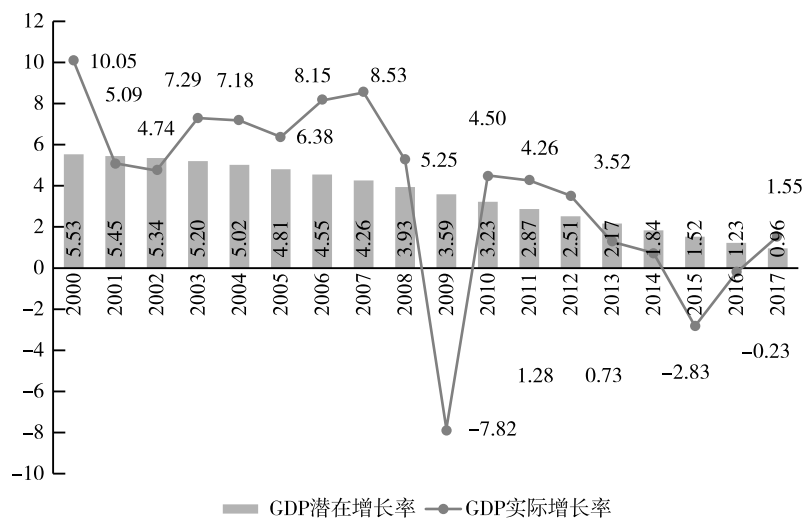
图3 俄罗斯 GDP 增长速度 (%)

2. 反通胀政策。俄罗斯中央银行的反通胀政策取得的成功有目共睹。三年前确定的到2017年年底实现4%通货膨胀的目标已稳步实现。这是苏联解体后俄罗斯通胀达到的一个前所未有的水平，为企业投资创造了新机遇。之所以能取得如此成绩，有赖于央行领导人坚定的反通货膨胀立场（紧缩货币信贷政策），也得到了总统的支持和政府削减财政开支的承诺。在2014~2015年俄罗斯受到外部冲击的情况下，这是唯一可能采取的行动。但要看到，截至2018年年初，俄罗斯的利率仍然是世界上最高的，超过5%。低通胀有助于增强对卢布的信任，2017年在储蓄增长情况下，居民外汇资产占比从23.9%下降至20.6%，而机构的外汇资产占比则从36%下降至34.7%。